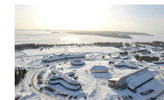
Aerial view of Oujé-Bougoumou town centre (Tourism Office/Post Office, Chiisemandoo-Miichwahp, Nation Headquarters, and Aanischaumkamikw Cree Cultural Institute).