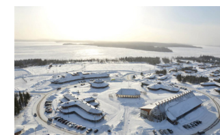
Aerial view of Oujé-Bougoumou town centre (Tourism Office/Post Office, Chiisemandoo-Miichwahp, Nation Headquarters, and Aanischaumkamikw Cree Cultural Institute).