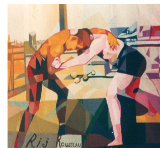
Jeanne Rij-Rousseau, Les Lutteurs , c. 1925. Tapisserie de haute lisse. Collection privée.