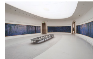
Claude Monet, Nymphéas (Water Lilies), c. 1914-26, oil on canvas, Musée de l'Orangerie, Paris. Second room, facing west wall