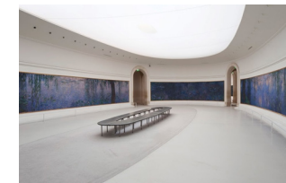
Claude Monet, Nymphéas (Water Lilies), c. 1914-26, oil on canvas, Musée de l'Orangerie, Paris. Second room, facing west wall