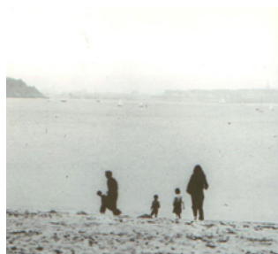
Christian Boltanski, Photo XI, tirée de L'album photographique de Christian Boltanski 1948-1956. (1972)