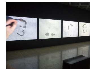
Oscar Muñoz, Project for a Memorial, 2005, installation at the Tamayo Museum in Mexico City, 2009.