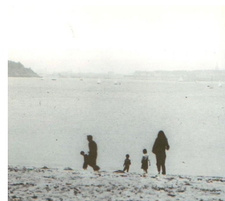
Christian Boltanski, Photo XI, tirée de L'album photographique de Christian Boltanski 1948-1956. (1972)