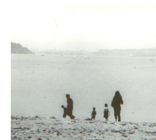
Christian Boltanski, Photo XI, tirée de L'album photographique de Christian Boltanski 1948-1956. (1972)