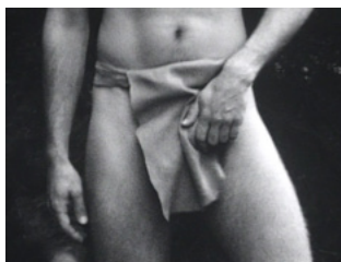
Crotch grab. Kent Monkman, Group of Seven Inches , 2005.