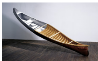
Nadia Myre, History in Two Parts , 2002, installation, bois de cèdre, cendre, sève, racines et aluminium, 14' x 4, x 3'.